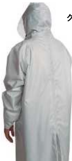
グレー サイズ：背丈120cm・胸囲125cm